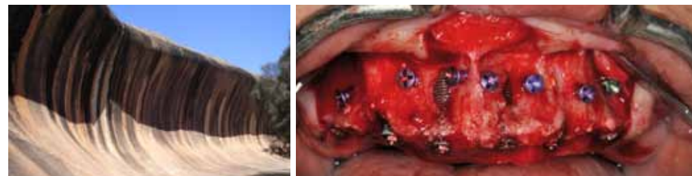
Wave Bone Technique

Cette présentation vous montrera, à l'aide de vidéos, comment appréhender les différentes situations cliniques lors de réhabilitations unitaires, partielles et complètes (Wave Bone Technique). Vous verrez également comment l'utilisation de vis d'osteosynthèse permet de créer un espace biologique de remplissage destiné à la maturation du matériau de comblement à la faveur d'une augmentation de volume osseux.